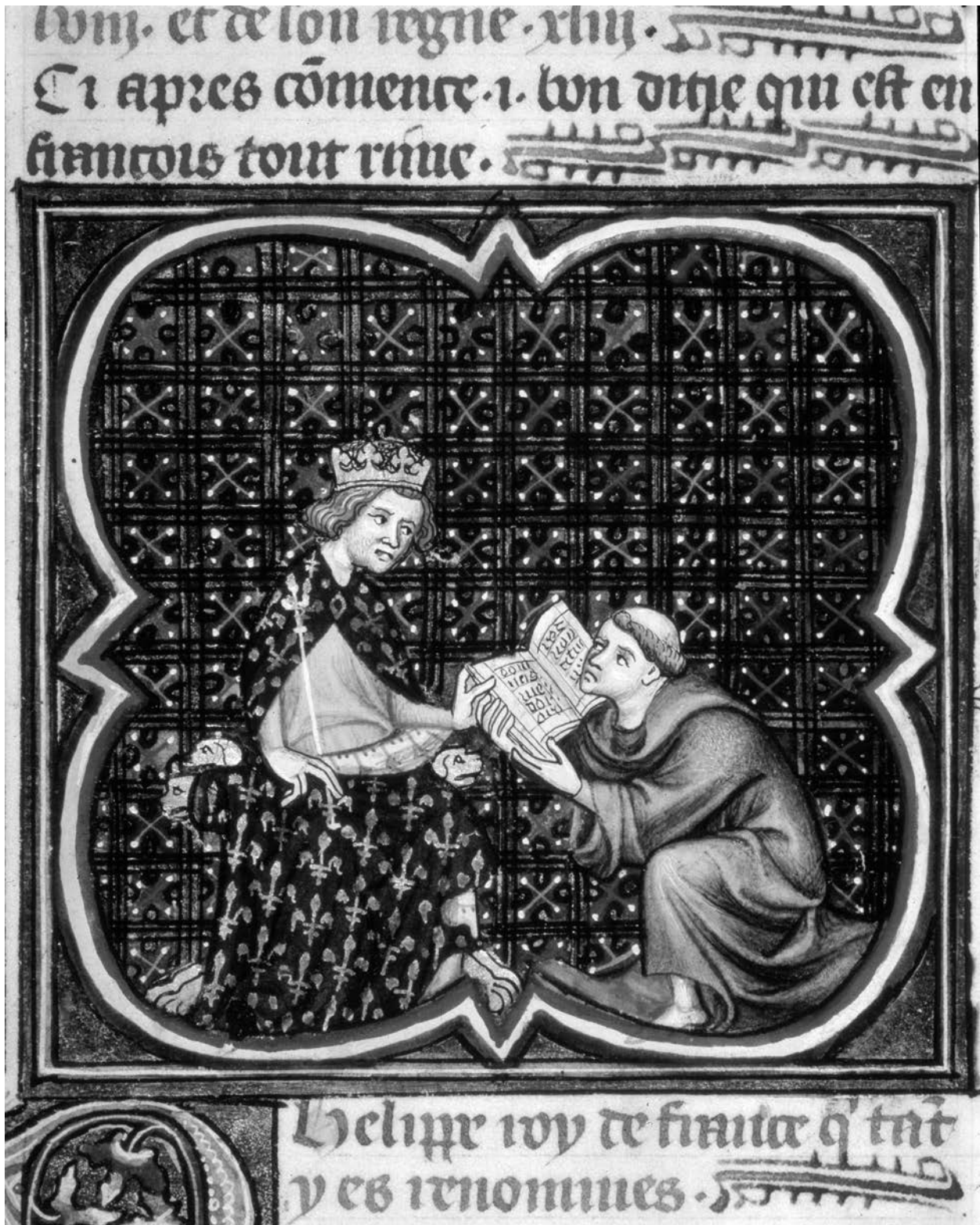
« Certains pourront voir dans cet ouvrage une déclinaison contemporaine du pacte entre le Prince et son chroniqueur, sur le modèle de ces chroniques du Moyen Âge destinées à "héroïser" l'homme d'action et à l'immortaliser ». Miniature tirée du manuscrit de Jean Fouquet (1420-1481), « Grandes Chroniques de France », Bibliothèque nationale de France, Paris.

Certains pourront voir là une déclinaison contemporaine du pacte entre le Prince et son chroniqueur, sur le modèle de ces chroniques du Moyen Âge destinées à « héroïser » l'homme d'action et à l'immortaliser.